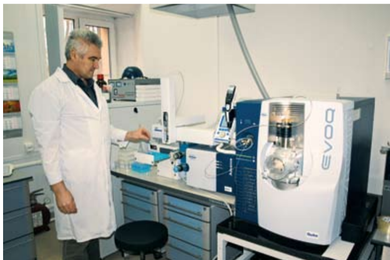
Тандемный жидкостный хромато-масс-спектрометр с тройным квадрупольным масс-анализатором TVOQ QUBE

В штате Ростовского референтного центра Россельхознадзора трудится 260 опытных высококвалифицированных специалистов: агрономы, семеноводы, химики, почвоведы, токсикологи, микробиологи, энтомопатологи, ихтиопатологи, ветеринарные врачи. 81% сотрудников центра имеют высшее образование, 7 специалистов имеют ученую степень. Большое внимание в центре уделяется вопросу повышения профессионального уровня сотрудников. Ежегодно специалисты испытательного центра и профильных отделов проходят стажировки, посещают курсы повышения квалификации в российских и зарубежных научно-исследовательских центрах и институтах.