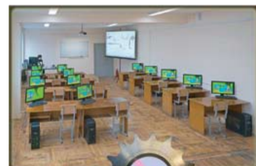
Современные компьютерные классы и лаборатории.

Ростовский колледж технологий машиностроения ул. Вятская, 35 +7 (863) 298 05 78 www.rktm.info Мы Вконтакте: vk.com/club29027482